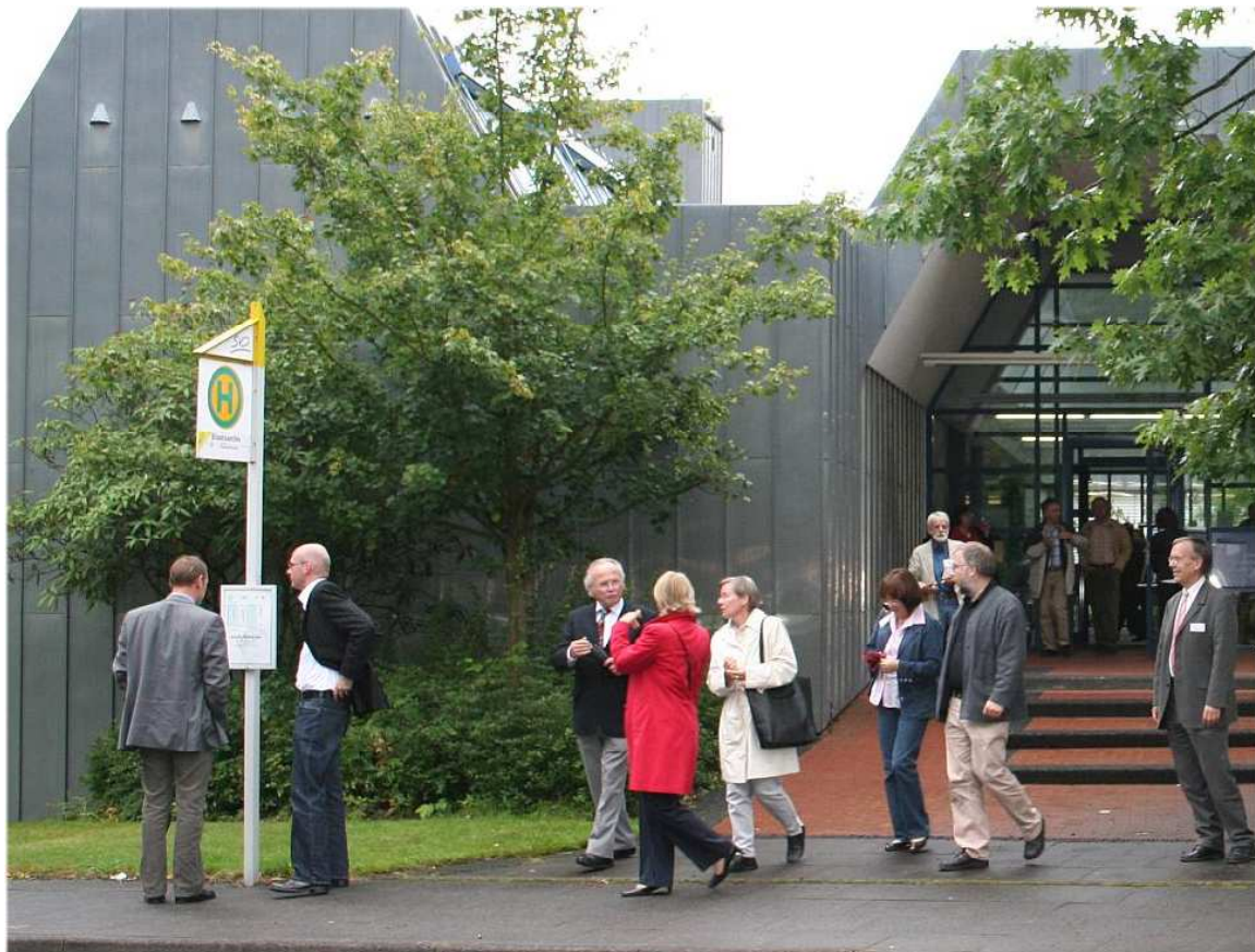
Staats- und Personenstandsarchiv Detmold